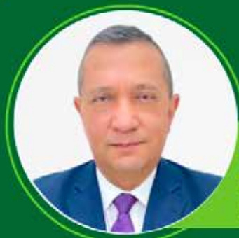
JUAN CARLOS SALAZAR SALAZAR

General de la Reserva Activa del Ejército