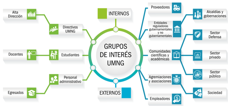
Figura 2. Grupos de interés institucionales

La UMNG propicia la participación y fortalece la interacción con sus grupos de interés identificados. Por consiguiente, la Estrategia de Rendición de Cuentas y Responsabilidad Social 2020-2021 de la «Universidad Militar Nueva Granada tiene como objetivo principal implementar estrategias que permitan fortalecer la confianza y la participación con los grupos de interés, involucrándolos en las actuaciones institucionales y recibiendo los aportes significativos para la mejora continua» (Universidad Militar Nueva Granada, 2019, p. 4).