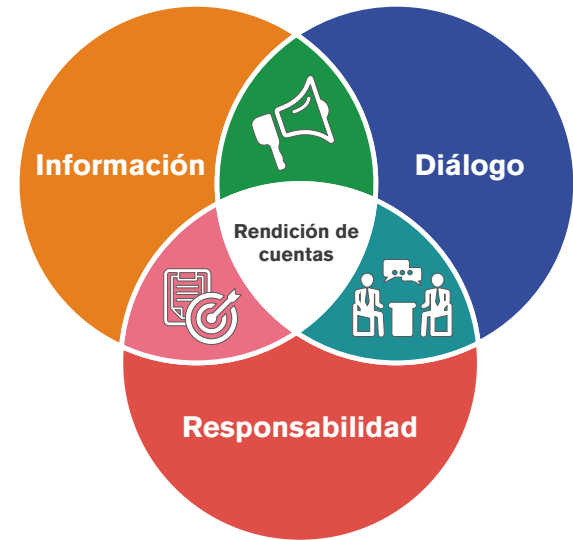
Figura 1. Elementos de la rendición de cuentas