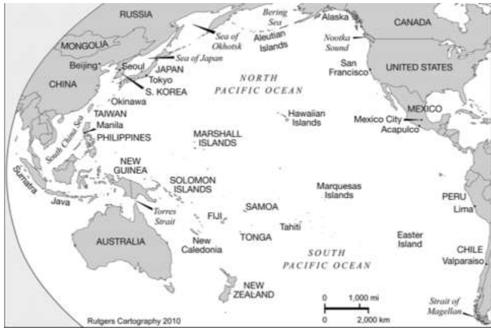
Gráfico 1. Mapa, Región Pacífico