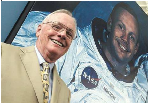
26 de agosto de 2012 - Neil Armstrong, comandante de la misión Apolo 11 y el primer hombre en pisar la Luna, murió el

sábado pasado a la edad de 82 años. Lo que hace a Armstrong un héroe estadounidense y una figura histórica conocida a través del mundo, no fue sólo el haber logrado eso que había sido el sueño de toda la humanidad por siglos, sino su dedicación para que el alunizaje no fuera el final, sino sólo el comienzo de la exploración del espacio. En lugar de hacerse ejecutivo de una empresa o una figura mediática, Armstrong se volvió profesor universitario, para ayudar a preparar la siguiente generación de exploradores.